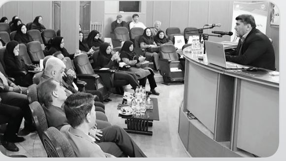
مدیرعامل شرکت آب منطقه‌ای فارس در جریان کارگاه آموزشی طرح داناب