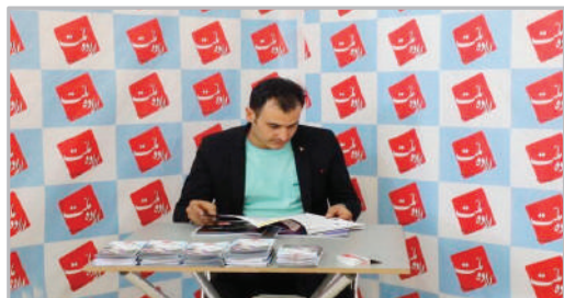
نمایشگاه رسانه‌های ایران