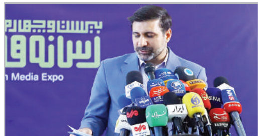
نشست خبری سخنگوی شورای نگهبان