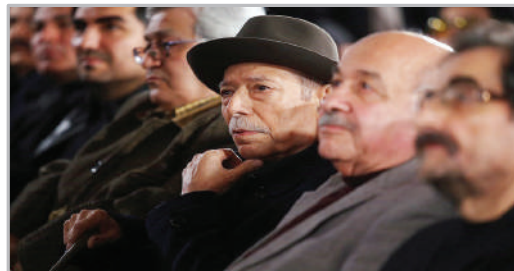
علی نصیریان در مراسم رونمایی از آلبوم راز عشق