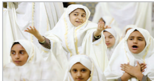
جشن تکلیف دختران دانش‌آموز در حرم علی بن مه‌زیار اهوازی