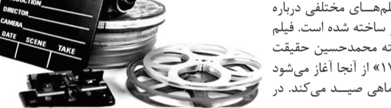
فیلم‌های مختلف دربارۀ جنگ ایران است

داخل شکم این ماهی، انگشتری است که مشخص می‌شود به شهیدی مفقودالار تعلق دارد. در ادامه حوادثی رخ می‌دهد تا این انگشتر به دست مادر آن شهید که سال‌ها چشم به راه خبری از فرزندش است، برسد.