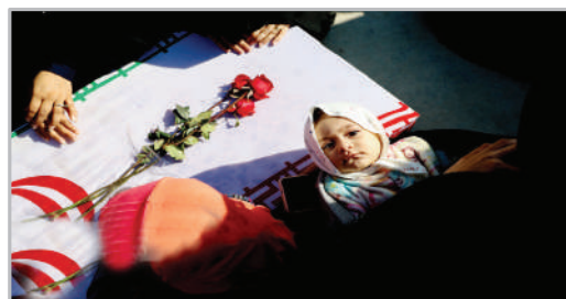
بازگشت پیکر مطهر ۳۳ شهید دفاع مقدس از شلمچه به کشور